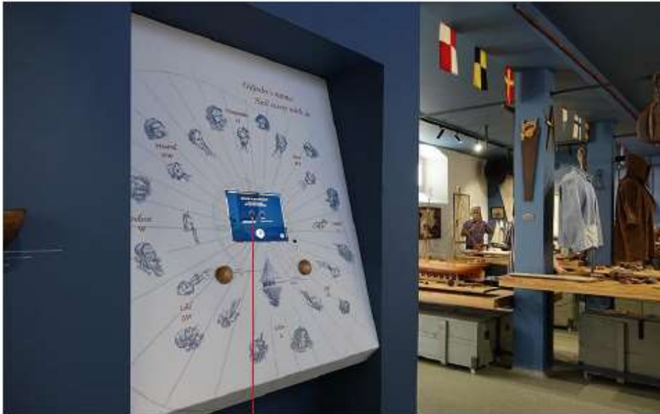
tablet Apple iPad pro + Apple camera adapter